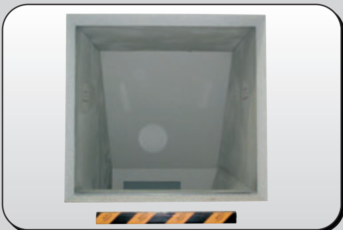
Safety first! Sicherheitskontakteleiste am Befülltrichter Safety-bar on feeding aperture