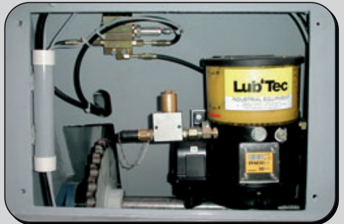
Schmierautomat mit Funktionskontrolle. Automatic lubrication, incl. function-control.