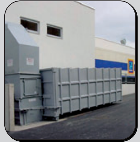
Wandanschluss-Trichter feeding-chute attached to building