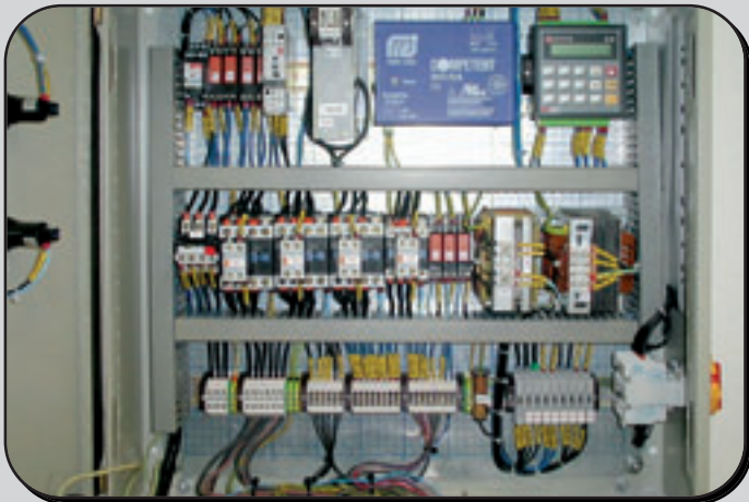
Einsatz von speicherprogrammierbarer Steuerung und saubere Verkabelung Operation via PLC, proper wiring