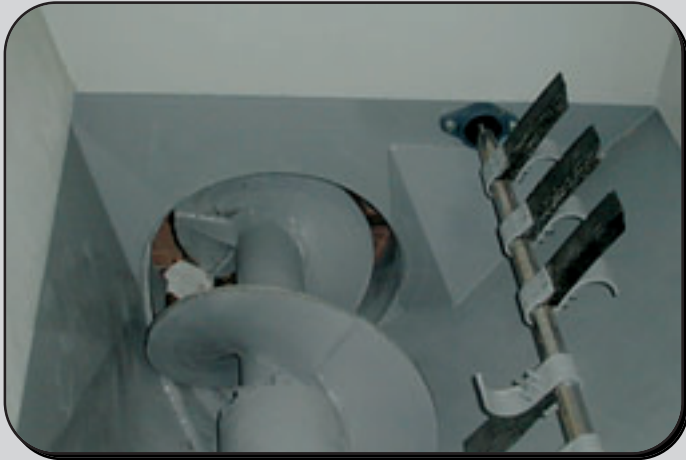
Wirksame Material-Zuführeinrichtungen Forced feeding-device for bulky materials